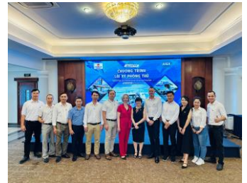
Thành viên AIGA VN tại hội thảo

❖ Tham khảo chi tiết: Chuong-trinh-lai-xe-phong-thu/